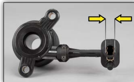
2. ábra: LuK CSC 510 0097 10 Hidraulikacsatlakozás 13,3 mm