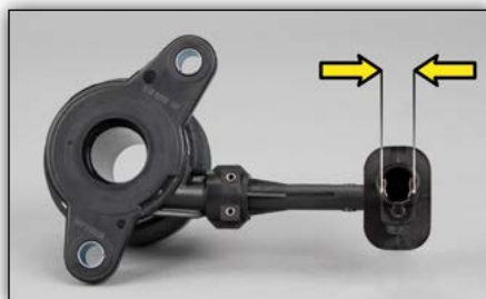
1. ábra: LuK CSC 510 0090 10 Hidraulikacsatlakozás 12,2 mm

Cikksz.: 510 0090 10 510 0097 10 510 0098 10 510 0137 10