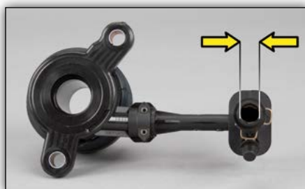
3. ábra: LuK CSC 510 0098 10 Hidraulikacsatlakozás 11,7 mm