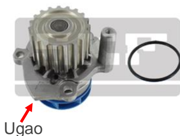
Stari Dizajn sa uglom