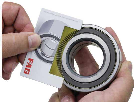
Obrázek 1: Pomocí karty enkodéru lze stanovit montážní stranu vícepólového enkodéru. U pasivních enkodérů to tak nefunguje

U aktivních systémů snímání otáček to lze snadno a rychle ověřit kartou enkodéru (obrázek 1).