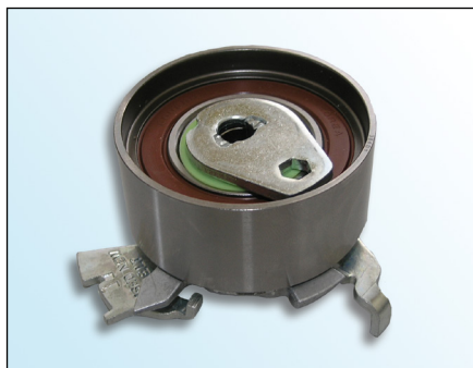
Снимка 1: 531 0626 30 (979488)