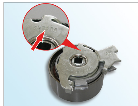
Снимка 2: 531 0626 30 (979488)

При монтажа на изброените по-горе обтяжни ремъчни ролки трябва да се гарантира правилното приложение на превозното средство.