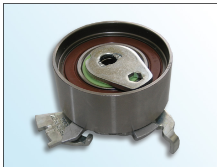
Figur 1: 531 0626 30 (979488)