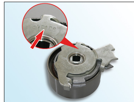
Figur 2: 531 0626 30 (979488)

Ved montering af de ovennævnte strammeruller skal man passe på den rigtige tildeling af køretøjer.