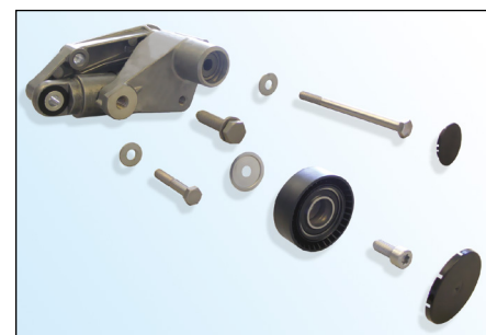
Fig. 3: Piese incluse

Pachetul conține și instrucțiunile de montare.