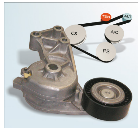
2. ábra: Az 1.9 TDI-motorba beszerelt 534 0132 30 cikkszámú feszítőkar a szíjfutással

A bordás-ékszíj erős dinamikus mozgásai következtében ezeknél a motoroknál előfordulhat zajképződés.