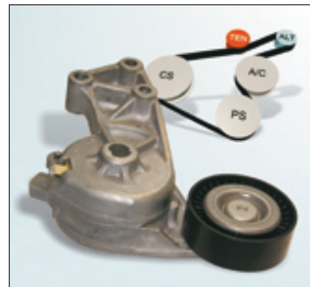
Fig. 2: In de 1.9 TDI-motor gemonteerdspanarm 534 0132 30 met riemverloop

Als gevolg van sterke, dynamische bewegingen van de multiriem kan deze motor lawaai produceren.