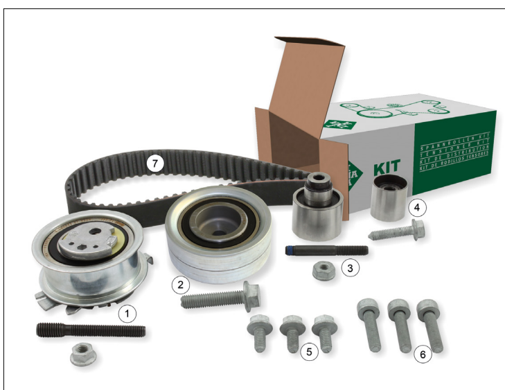
Fig. 1: Kit fulie întinzător INA kit 530 0550 10

*Set = cureaua de distribuție nu este inclusă