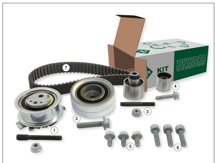
Снимка 1: Комплект обтяжма ролка INA 530 0550 10

Всички компоненти в обтяжния блок са разработени да постигат еднакъв сервизен живот и са обект на еднакво износване.