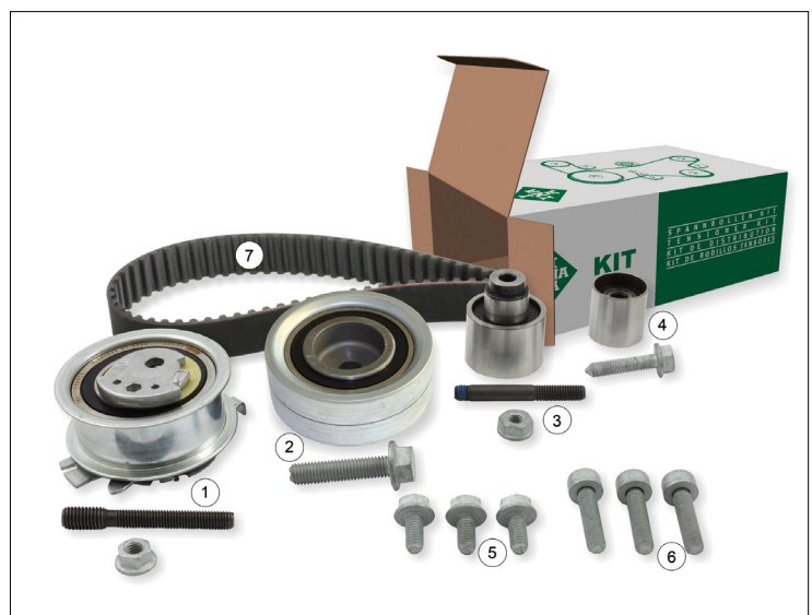
Obrázek 1: INA KIT napínací kladky 530 0550 10

Všechny komponenty napínací jednotky jsou konstrukčně dimenzovány na stejnou životnost a podléhají společnému opotřebení.