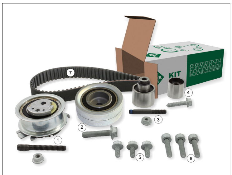
Figur 1: INA strammeremskivesæt 530 0550 10

Alle komponenter i taktkædeaggregatet er designet til at opnå den samme levetid og udsættes for samme mængde slid.