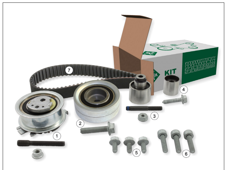
Εικόνα 1: Τροχαλία τάνυσης INA Kit 530 0550 10

*Set = δεν περιλαμβάνεται ο ιμάντας χρονισμού