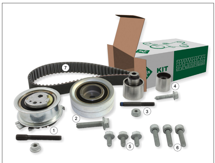
1. ábra: INA feszítőgörgő-készlet 530 0550 10

A vezérlés meghajtásának minden komponensét azonos élettartamra méretezték és együttes kopásnak vannak kitéve.