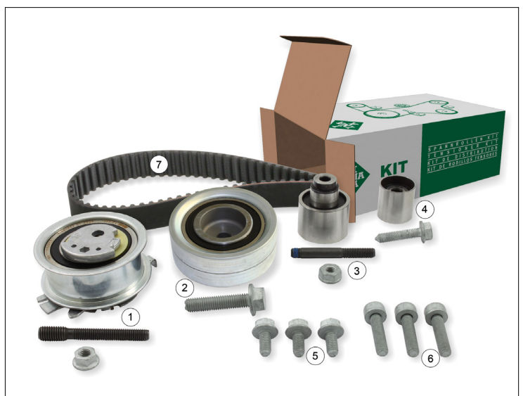
Bild 1: INA KIT spännrullar 530 0550 10

Samtliga komponenter hos remspännarenheten har dimensionerats till samma livslängd konstruktionsmässigt och de utsätts för gemensamt slitage.