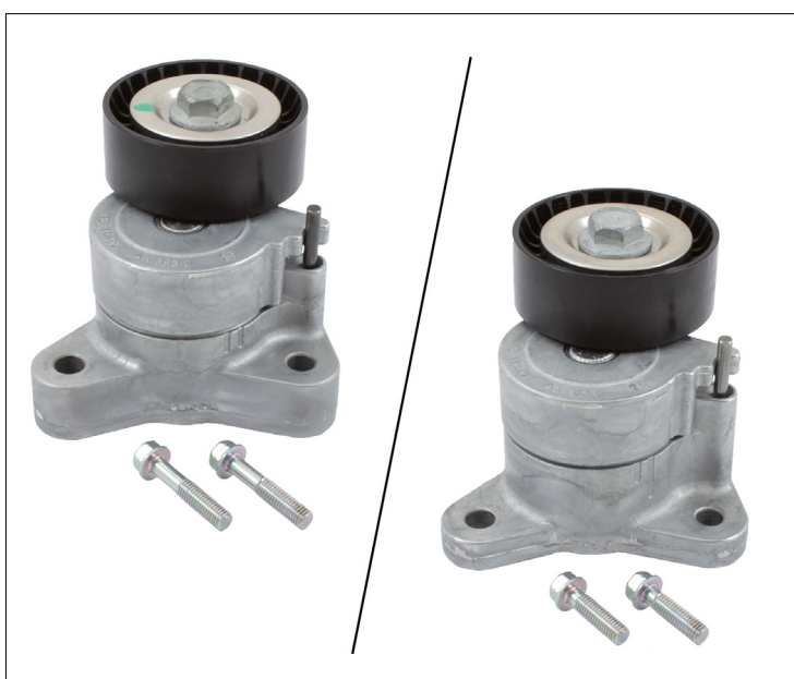
Снимка 1: Обтяжно рамо 534 0325 10 – ляво, стара версия с фиксиращи болтове. Дясно, нова версия с фиксиращи болтове.

Mitsubishi 1345A059 (заменен) 1345A079 (нов)