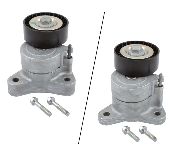
Kuva 1: Kiristinvarsi 534 0325 10 – vasemmalla, vanha malli kiinnitinsruuveilla. Oikealla, uusi malli kiinnitysruuveilla

Mitsubishi: 1345A059 (korvattu) 1345A079 (uusi)