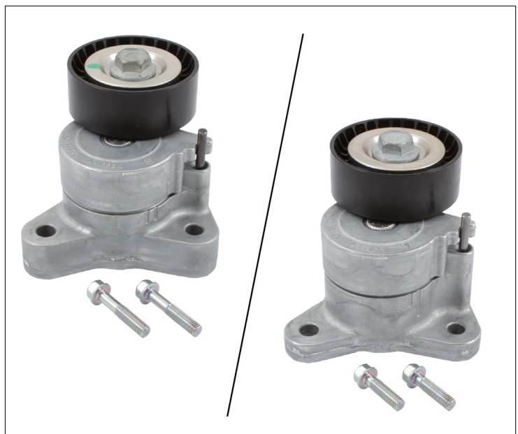
Obrázok 1: Napínacie rameno 534 0325 10 – vľavo, staré vyhotovenie s upevňovacími skrutkami Vpravo, nové vyhotovenie s upevňovacími skrutkami

Mitsubishi: 1345A059 (nahradené) 1345A079 (aktuálne)