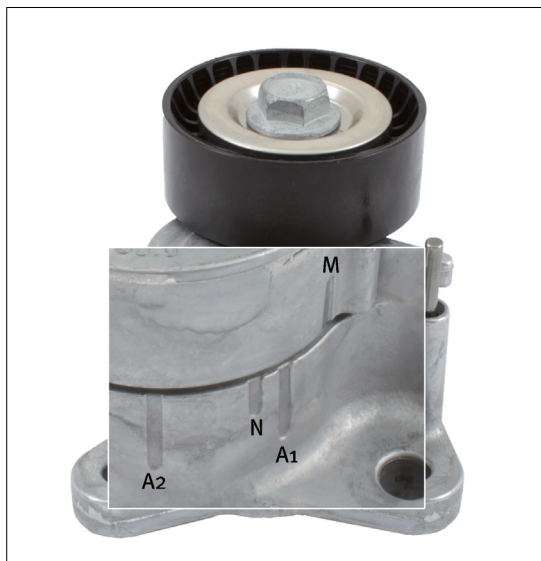
Obrázok 2: Zmenené značenie pre pracovné oblasti napínacieho ramena

Pri nasadenom klinovom rebrovanom remeni a vytiahnutom aretačnom kolíku sa musí značka na páke (M, obrázok 2) nachádzať približne v oblasti menovitej pozície (N, obrázok 2). Pri bežiacom motore sa posunie značka na páke do pracovnej oblasti medzi A1 a A2 (obrázok 2).