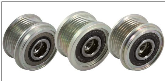
Снимка 2: Ролки за свободен ход на алтернатор 535 0063 10 (ляво), 535 0202 10 (център), 535 0203 10 (дясно)

Ролката за свободен ход на алтернатор, изолира спомагателното задвижване от ротационните несъответствия на двигателя, осигурявайки плавна и по-тиха работа на каналния ремък. Като резултат, двигателя е по-тих, което прави шофирането по-комфортно.