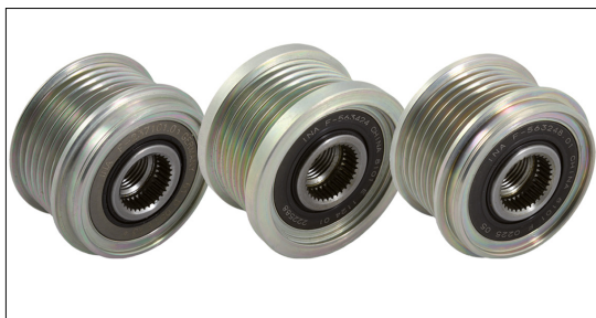
2. ábra: Generátor szabadonfutók 535 0063 10 (balra), 535 0202 10 (középen), 535 0203 10 (jobbra)

Figyelem: Feltétlenül ügyeljen a mellékelt beszerelési utasításra!