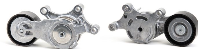
Obrázek 2: nové provedení

Na základě trvalého dalšího vývoje našich produktů byla modifikována alternátorová volnoběžka s objednací číslem 534 0075 20.