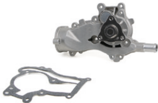
Fig. 1: 538 0314 10 - Bomba de água com junta plana incluída

Consulte a atribuição atual nos catálogos