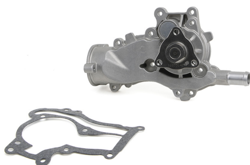
Fig. 1: 538 0314 10 – Pompă de răcire cu garnitura aferentă

Pentru listele actuale consultați cataloagele în diferitele forme de prezentare