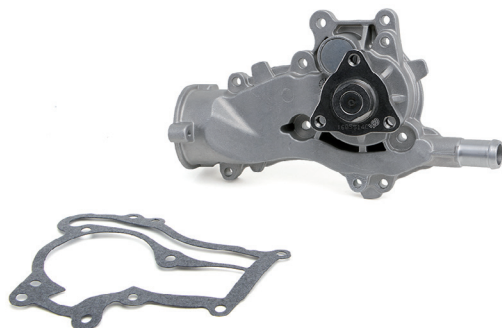
Slika 1: 538 0314 10 – vodena pumpa i pripadajuća plosnata brtva

Za brtvljenje kućišta vodene pumpe kataloškog broja 538 0314 10 koristi se plosnata brtva. Nanošenje mase za brtvljenje na dosjedne površine NIJE dozvoljeno.