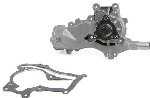
Figura 1: 538 0314 10 - pompa del acqua con guarnizione piatta fornita

Per l'assegnazione attuale, consultare i cataloghi