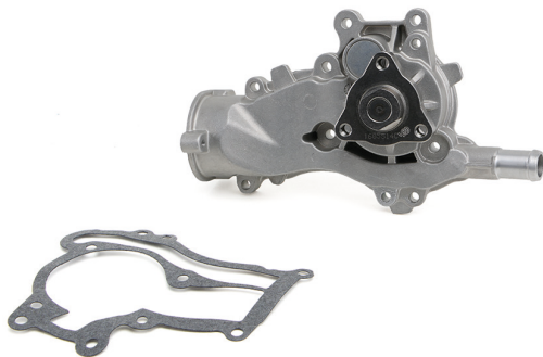
Fig. 1: 538 0314 10 - koelmiddelpomp met meegeleverde vlakke afdichting

Actuele selectie zie onderdelencatalogus