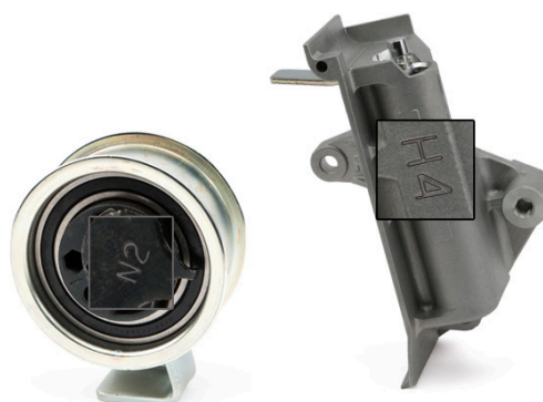
Снимка 2: Обтяжна ролка 531 0436 20 с вибрационен демпфер 533 0035 10