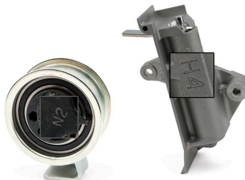
Εικόνα 2: Τεντωτήρας 531 0436 20 με τον αποσβεστήρα 533 0035 10