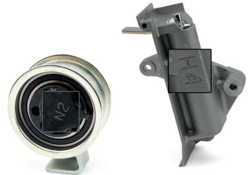
Kuva 2: Kiristinpyörä 531 0436 20 ja värinänvaimennin 533 0035 10