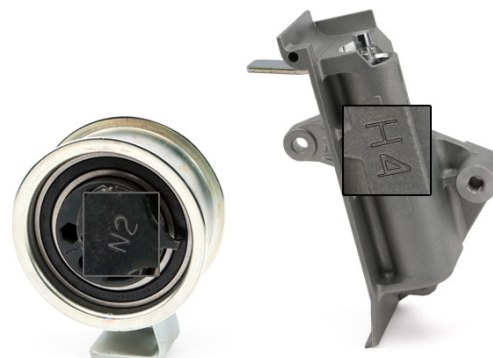
2. ábra: 531 0436 20 cikkszámú feszítőgörgő az 533 0035 10 cikkszámú rezgéscsillapítóval