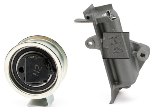
Afbeelding 2: Spanrol 531 0436 20 met trillingsdemper 533 0035 10