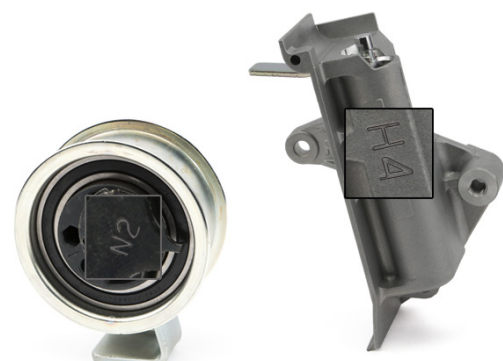
Figura 2: Fulia întinzătorului 531 0436 20, cu amortizorul de vibrații 533 0035 10