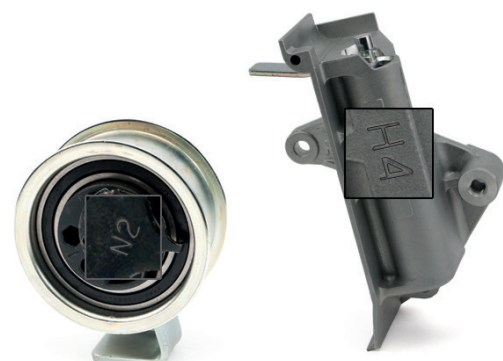
Bild 2: Spännrulle 531 0436 20 med vibrationsdämpare 533 0035 10