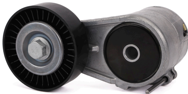
1. ábra: Példa egy régi kivitelre rögzítőcsappal

Mindkét típus teljesíti a műszaki specifikációkat és azokat korlátlanul fel lehet használni. Az átmeneti időszakban vegyes készletek fordulhatnak elő.